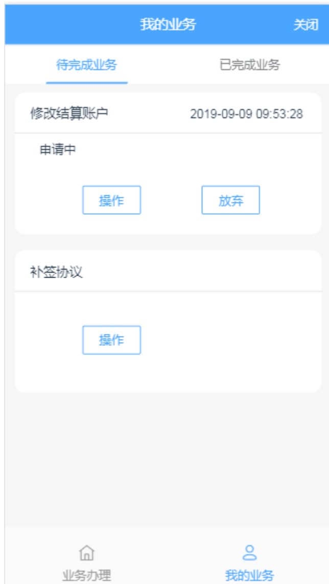
图9 我的业务 在已完成业务中不允许客户对其进行操作。