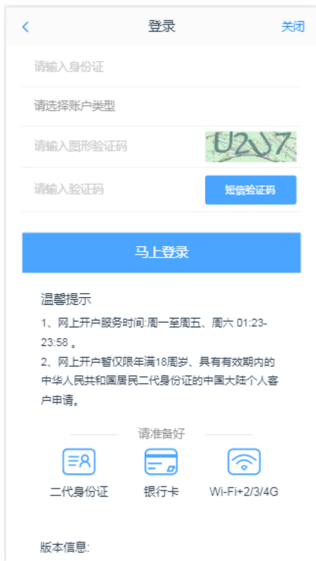
图 3 身份证登录页面

图 3 期货互联网开户云登录界面介绍了在开户之前必须要了解的知识 and 必备的硬件条件，需要准备身份证和银行卡，开户所使用的手机必须具备以下的硬件条件并保证可以正常使用：摄像头、麦克风、扬声器等，在开户过程中，系统会自动检测这些硬件的正确性，否则会被阻止开户。