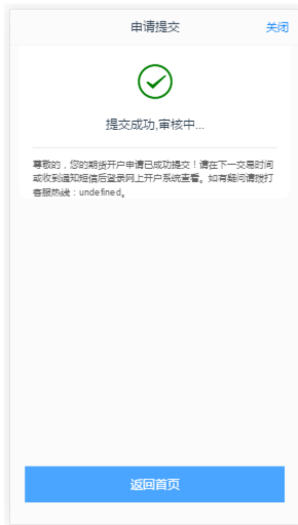
图 8 修改结算账户提交