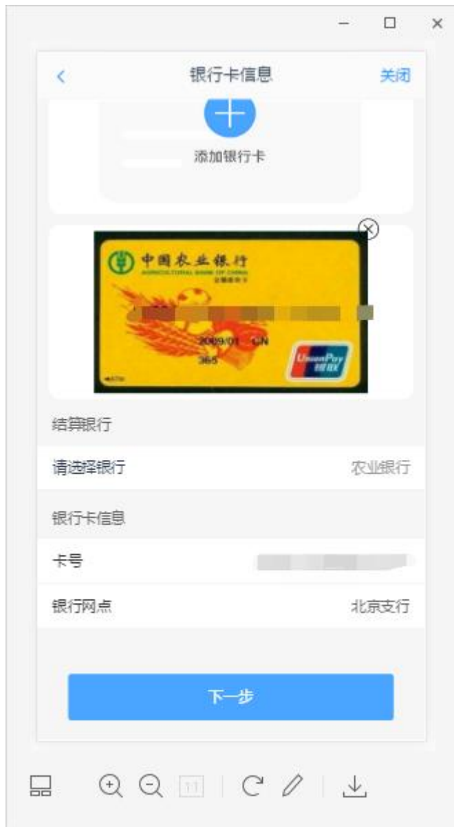
图 6 银期绑定