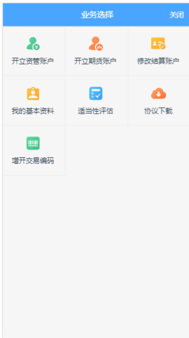
图 2 业务选择页面