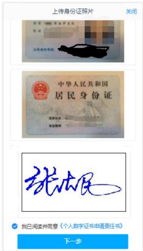
图 5 上传身份证页面

所有照片都上传成功以后，请阅读“数字证书安全责任书”，阅读完成并同意后点击“下一步”进入到“银期绑定”页面。