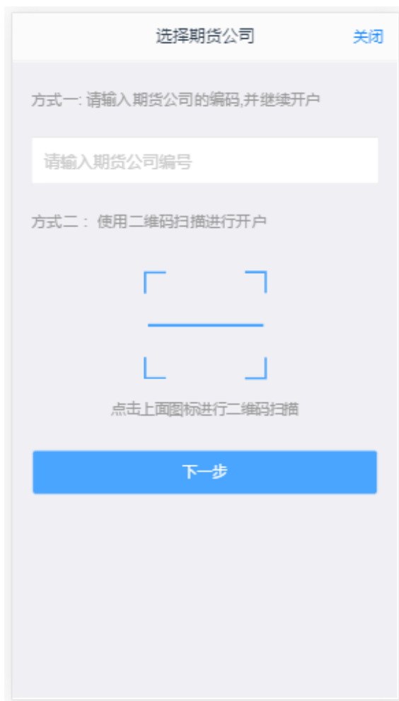
图 1 输入期货公司编号页

打开开户云 app，登录以后会出现如图 1 所示的页面，有两种方式进行开户，第一种可以直接在输入框输入期货公司编号进行开户，第二种点击扫描下方二维码开户，点击下一步，接着会到业务选择页面，点击修改结算账户会进入到身份证登录页面，如图 2，图 3。